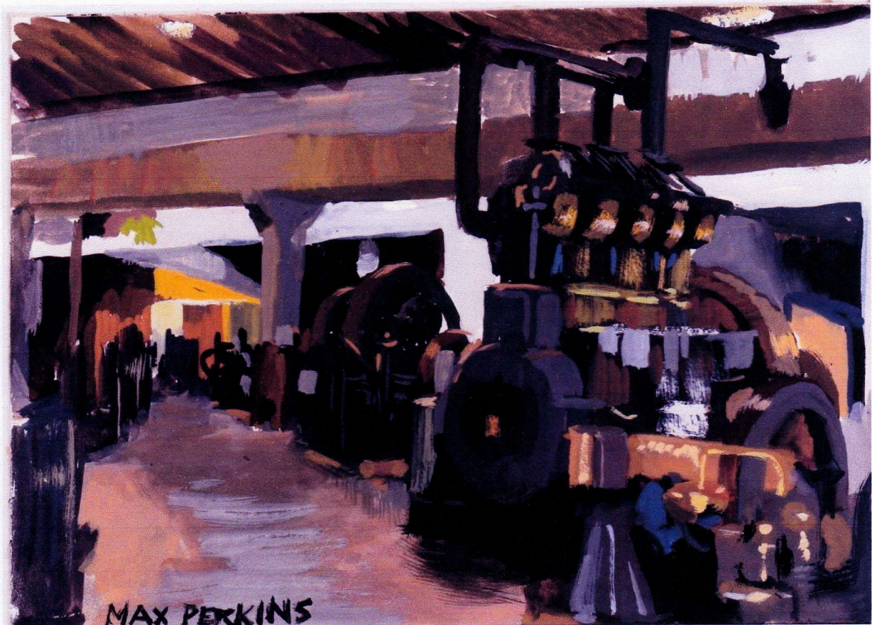
Vue d'artiste du Muséum

Peu à peu les artistes y ont trouvé un intérêt : d'abord il y avait là les moyens de faire faire quelques réparations par exemple sur un cadre abimé, ou sur une soudure mal réalisée; de plus il y avait aussi là des sujets d'inspiration et une vaste salle d'expositions.